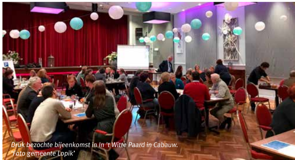
Druk bezochte bijeenkomst in In 't Witte Paard in Cabauw.

Zoals u wellicht hebt gehoord of gelezen, wil de gemeente Lopik inwoners en organisaties actief betrekken bij de verdere ontwikkeling van het Sociaal Domein. De gemeente hoopt zo op een waardevolle bijdrage om het beleid een goede richting te geven. Hiervoor worden vier bijeenkomsten georganiseerd in de vorm van de klankbordgroep 'Samen doen!'